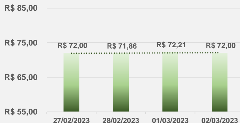
Evolução da Média Estadual na semana