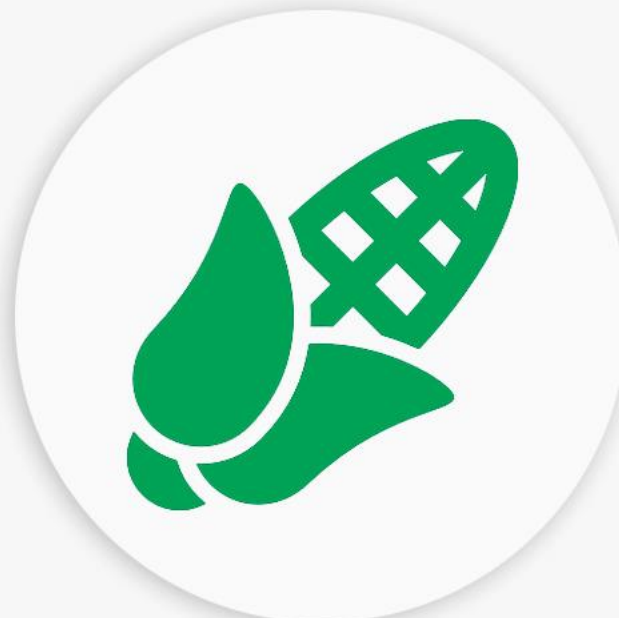
Preços da saca de milho no Mato Grosso do Sul e Futuros

Nesta semana a colheita americana de milho atingiu a marca de 96% da área esperada, estando abaixo dos 99% de área colhida em igual período de 2022.