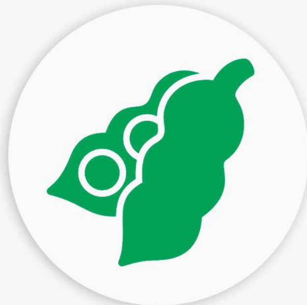
Preços da saca de soja no Mato Grosso do Sul e CBOT

O cenário e os fundamentos para a soja brasileira transparecem um quadro de instabilidade, com menor demanda na China e aversão à risco. Apesar disso existe escassez de oferta nos mercados globais. Tudo indica que os negócios correrão com cautela, fomentando fortes incertezas em relação ao caminhar dos preços na semana.